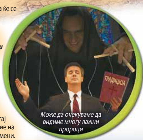
Може да очекуваме да видиме многу лажни пророци

Не можеш секогаш да веруваш на она што го гледаш со очите. Библијата ни кажува дека, пред Исус да дојде, можеме да очекуваме да видиме многу лажни пророци. Некои дури ќе прават чуда и ќе изјавуваат дека се Исус, но ако нивните постапки или зборови не се согласуваат со Библијата, држи се понастрана од нив! (Прочитај Исаија 8,20 и 2. Коринќаните 11,14.15.) Благодарение на Исус и неговиот Збор, не мораме да бидеме измамани.