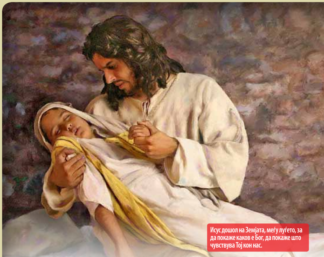
Исус дошол на Земјата, меѓу луѓето, за да покаже каков е Бог, да покаже што чувствува Тој кон нас.