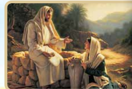
Библијата ни кажува дека човекот има незамислива вредност, тој е создаден според Божјиот лик.

Многу меѓу денешните описи на татковци не се најпривлечни. Има немарни, груби и уморни од животот. Бог не е таков. Тој е грижлив и чувствителен татко. Татко кој сака да го минува времето со своите синови и ќерки, Татко кој ги воспитува со своите убави приказни.