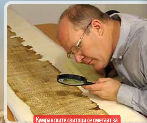
Кумранските свитоци се сметаат за едно од најголемите откритија во Библиската археологија.

На Институтот за нуклеарно истражување на Универзитетот на Чикаго, откако свитокот бил