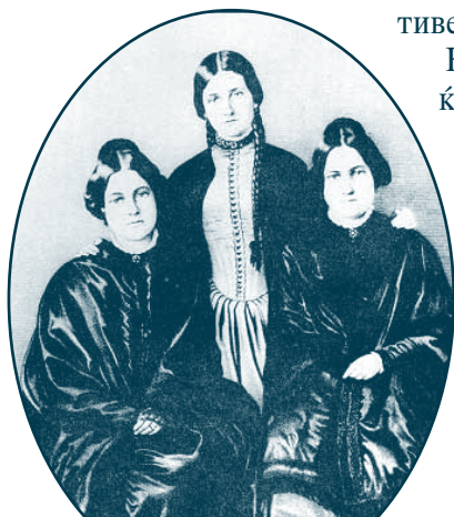
Модерниот спиритизам се појавил во Со-единетите Американски Држави во 1848 година во местото Хадсвил, недалеку од Њујорк, во куќата на семејството Фокс.