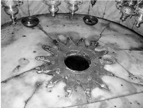
1.1 Местото каде што се родил Христос

Ангелите вака ја продолжуваат својата посебна порака: „Зашиџо денес ви се роди Сџасиџел, во Давидовиоџи џрад, кој е Хрисиџос Госџод. И ова ви е знак: ке најдеџиџе Младенче џовиено, како лежи во јасли! И одеднаџи со анџелоџи се најде множесџиво небесно воинсџиво, кое џо фалеше Боџа, велеџки: 'Слава на Боџа во висиниџе и на земјаџиџа мир, во луџеџиџо добра волја!'“ (Лука 2,11-14). Каква прес-конференција! Ангелот се обраќа до пастирите, кои во ноќта ги пасат своите стада на ливадата, со една радосна вест! Познат е фактот дека пасти-