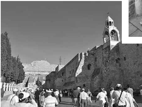
1.3 Црквата на Христовото раѓање во Витлеем