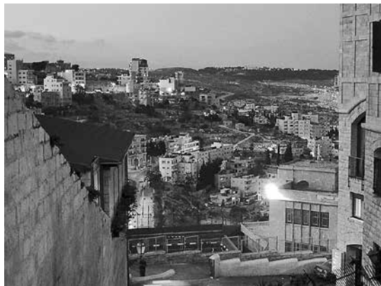
1.4 Витлеем ноќе: во заднината се наоѓаат ридовите на кои престојувале пастирите

Човечкото срце возбудено чука додека се приближува кон Црквата на Христовото раѓање во Витлеем, бидејќи доаѓа на местото каде што Исус се родил. Во тоа време луѓето живееле во мали куќи, колиби, и историчарите забележале дека својот добиток го чувале во подрумите под куќите или во пештерите близу до куќите, а и пештерите околу Витлеем сигурно биле користени за таа цел. Црквата на Христовото раѓање е изградена уште во 4. век по Христа, по наредба на царот Константин Велики. Влезот е необично низок и тесен, за да се оневозможи некој да влезе во црквата јавајќи на коњ. Оној што сакал да влезе, бил приморан да се наведне и на тој