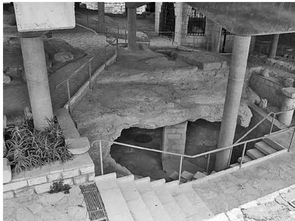
1.6 Остатоци од згради во Назарет од Христово време

Јосиф како да насетува дека ќе се случи нешто важно и дека тој ќе биде дел од тоа. Насетува чудо. Но, како се однесувале луѓето во тоа време кон таквото чудо? Елисавета, роднина на Марија, во своите позни години забременила и родила дете – Јован Крстителот (Лука 1,57-80). Во нејзиниот случај луѓето организирале голе-