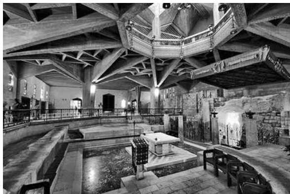
1.5 Црква на благовестието во Назарет

вклопува во месијанските пророштва што веќе ги цитиравме. Ц. С. Луис, човекот кој првобитно бил атеист па станал христијанин, бил вистински научник, кој со научни методи дошол до заклучок дека Исус е вистинска личност, присутна во животот на секој од нас. Тој почнал да ја проучува Библијата и, за сторијата за Исусовото раѓање, изјавил: „Целата сторија се стеснува, додека не дојдеме до една точка, толку мала како врвот на стрелата – до една кривка, млада Еврејка на колена...“ 2 Бог меѓу сите луѓе одбрал едно младо создание кое ќе биде најдоброто „пакување“ на овој величествен небесен дар, кој ќе го носи името Исус.