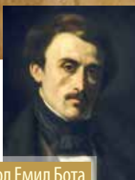
Пол Емил Бота

Дваесетина километри североисточно од Ниневија, на левиот брег на потокот Косар се наоѓа селото Корсабад, чие име значи „Градот на Косро“. Ова место во древните времиња било познато како Дур-Шарукин, некогашна резиденција на асирскиот цар Саргон II (722-705 година пред Христа).