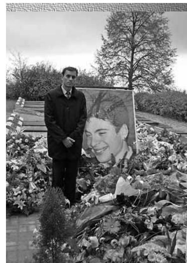
На гробот на Тоше Проески

2. Често поставуваните прашања: Господе, зошто дозволи тоа да се случи? Зошто, Господе, толку млад да го заврши својот живот?