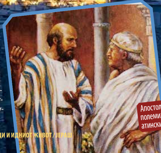
Апостол Павле полемизира со атинските филозофи

Набргу по пристигнувањето на Павле во Атина, тој ја посетил Агора (пазарот). Видел мноштво храмови, а многу-