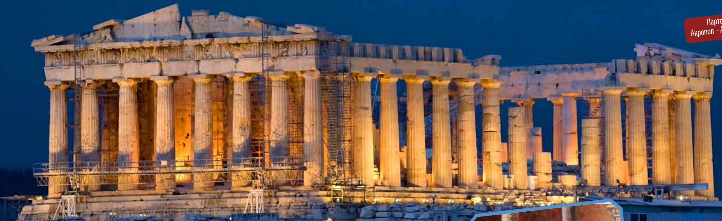
Партенон, Акропол - Атина

бројни мермерни кипови биле наредени од двете страни на улиците. Павле, со својот строг еврејски став против идолопоклонството, бил стаписан кога го видел тоа обожување на режани ликови. „Духот на Павле се вознемируваше" (Делата на апостолите 17,16). Не можел да ги чека своите сопатници да стигнат од Вереја, „и тој расправаше во синагогата со јудејците и љубожните, и секој ден на љошадото соние што ќе ги среќнаше" (стих 17). Неговата елоквенција и уверливите аргументи го привлечеле вниманието на градските филозофи, додека тој „им проповедаше за Христа и за во-