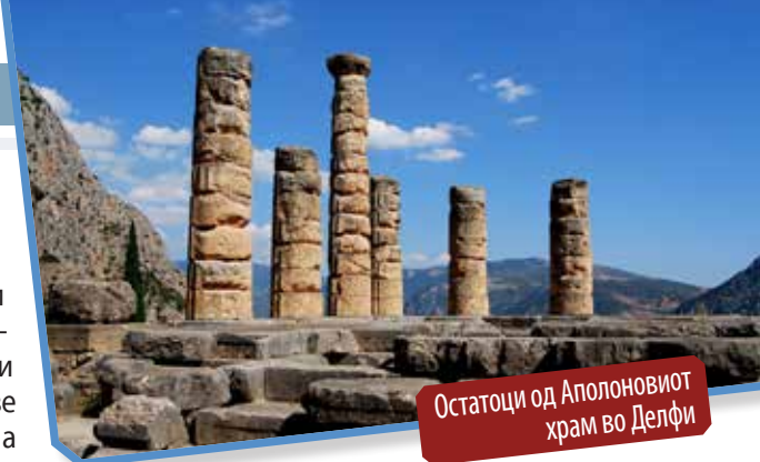
Остатоци од Аполоновиот храм во Делфи

Иако имале многу напредна култура и филозофија, зачудува фактот дека Грците имале мошне замаглена слика за Бога. Легендите за грчките херои и божества биле многубројни, па тоа довело до политеизам – верување дека постојат многу богови. Тешко е да се набројат сите божества на кои им се поклонувале тие; грчката религија била мошне лабава во верувањата. Немало догми ниту свештеничка класа, религиозните