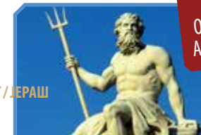
Грците верувале во многу богови. Од горе надолу: Атина, Аполон, Хера, Посејдон