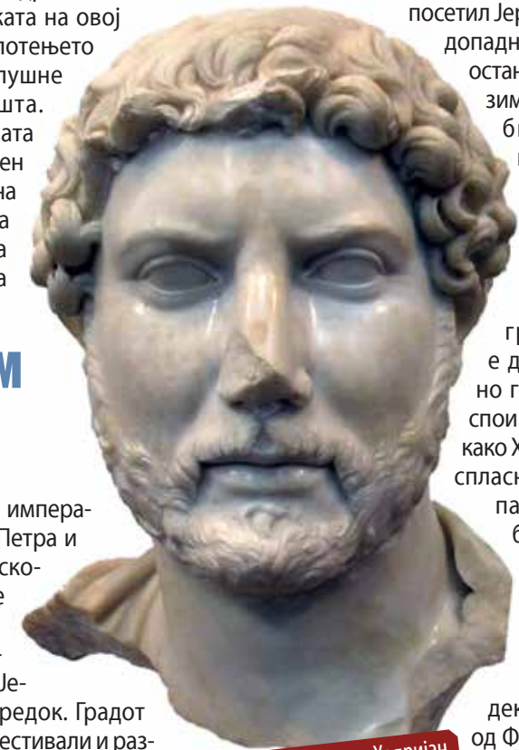
Императорот Хадријан го посетил Јераш

Во 129 год. императорот Хадријан го посетил Јераш. Веројатно му се допаднало местото, зашто останал таму речиси цела зима. Неговиот престој бил прославен со голема активност на реновирање на јавните градби, при што бил изграден и триумфален свод во јужниот дел на градот. Очигледно е дека било планирано градскиот сид да се спои со овој свод, но откако Хадријан си заминал, спласнал и ентузијазмот, па сидот никогаш не бил довршен. Сводот со своите недовршени страни сè уште се наоѓа во Јераш. Еден натпис на него укажува дека тој бил изграден од Флавиј Агрипа. Во текот на вториот век Јераш бил на врвот од својата