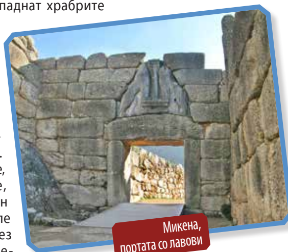
Микена, портата со лавови

Освен неколку бранители кои ги бранеле бедемите на Акропол, Грците ја напуштиле Атина и се повлекле на полуостровот Пелопонез. Исфрустрирани од тоа, Персијците го излеале