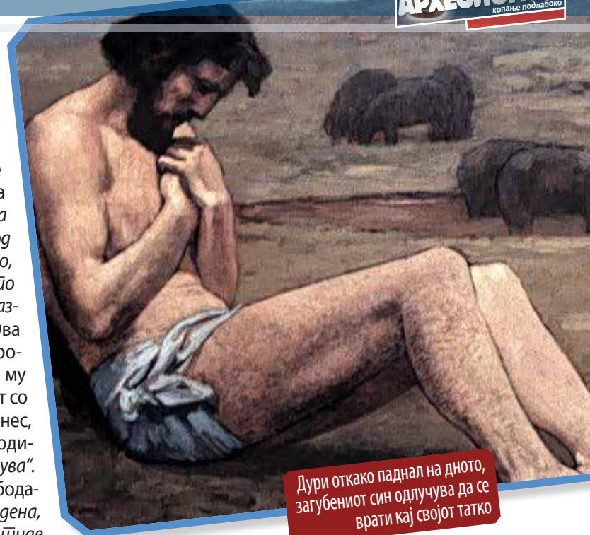
Дури откако паднал на дното, загубениот син одлучува да се врати кај својот татко

По сè, домот и не бил толку лошо место, таму дури и слугите имале доволно храна. Кога „Дојде на себеси“ донесол одлука да се врати. (стих 17).