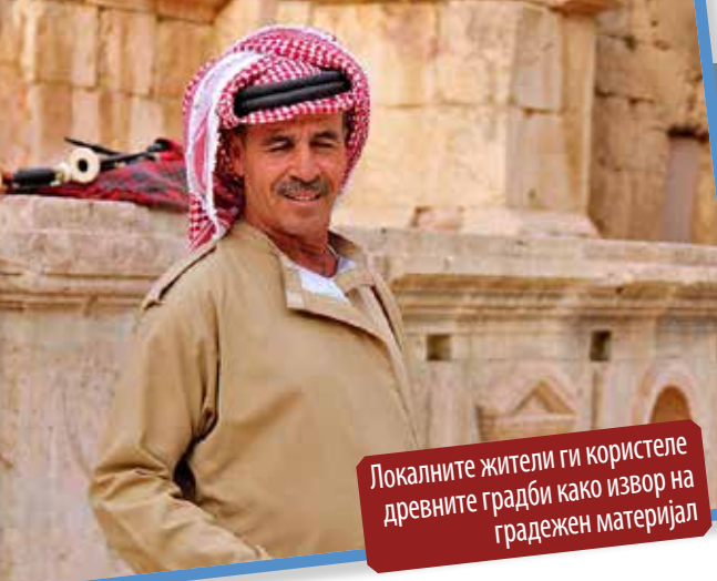
Локалните жители ги користеле древните градби како извор на градежен материјал