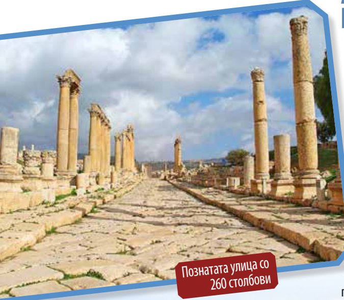
Познатата улица со 260 столбови