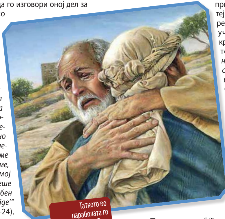
Таткото во параболата го претставува Бога

се каел за своите постапки. Загубениот син го започнал говорот што го вежбал од мигот кога ги напуштил свињите. „И синои мурече: Татко, зџрешив ѓроштив небоио и ѓред шибе и не сум веќе дошгоен да се наречам твој син!“ (стих 21). Но пред да го изговори оној дел за работата како наемник, „шашкошо им рече на слугише свои: 'Изнесе ше најубава облека и облечеше жо, и дајше му ѓрсиен на ракашга негово и обувки на носеше; ѓа доведеше едно згоено шеле и заколеше жо; да јадеме и да се веселиме, зашто овој мој син мршов беше и оживе, иззубен беше и се најде“ (стихови 22-24). Загубениот син не бил веќе загубен, тој повторно бил прифатен како син.